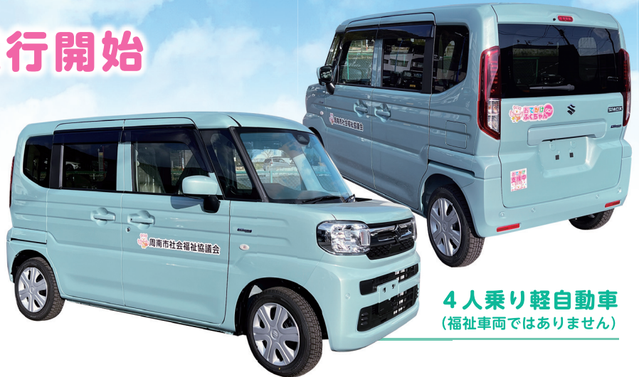
4人乗り軽自動車 (福祉車両ではありません)

周南市社会福祉協議会では、高齢者や障がい者の移動支援をサポートするとともに、住民相互の助け合い活動や地域団体のボランティア活動を支援するために、 車両の貸し出し を行います。