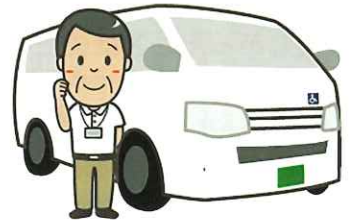
いきいきサロン等への送迎