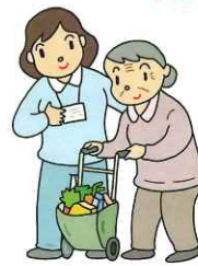
買い物の付き添いや代行