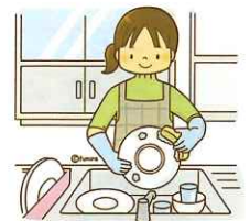
調理や居室の掃除等の家事代行

こうした“共に支え合う大河内のまちづくり”に対して、みなさんはどのようにお考えでしょうか。実施する組織や団体の立ち上げや運営も大切ですが、お助けを希望される地域の皆さんの声も大切です。互いに思いを出し合って、住みよい大河内のまちをつくりたいと思います。