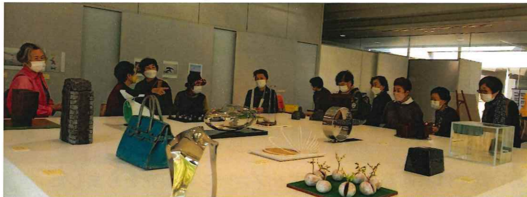
社協バスで宇部常盤公園開催中のビエンナーレ展と植物園見学