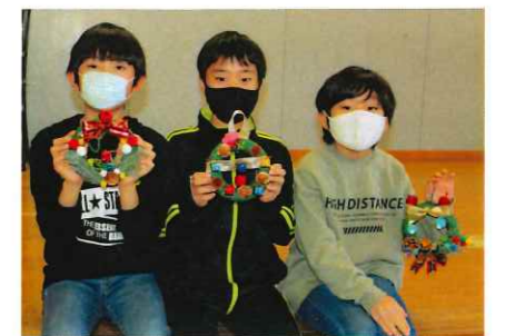
僕のリース、かっこいい