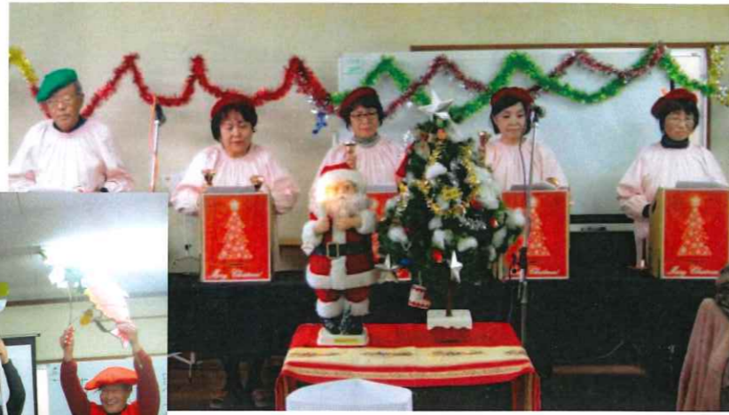
クリスマス飾り キレイに出来ました