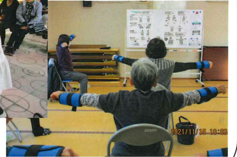
百歳体操「元気で長生き ピンピンコロリ」