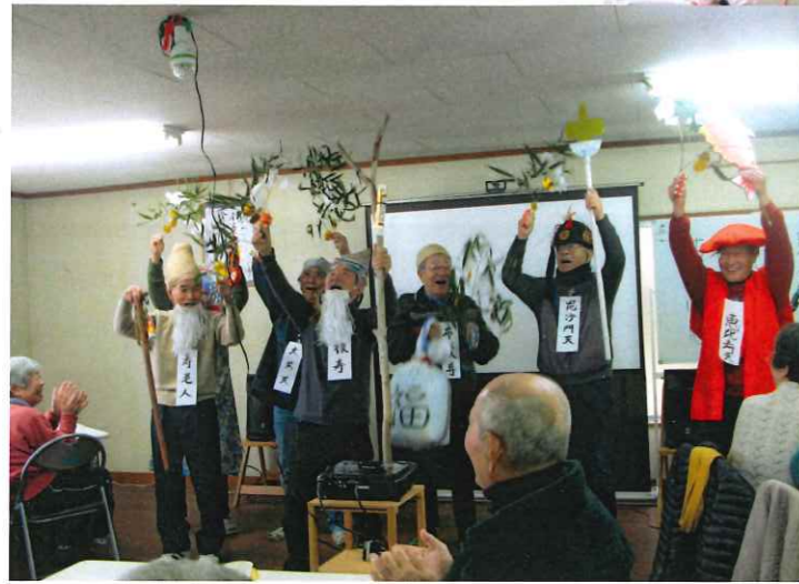
初笑い 七福神でお笑い講 !