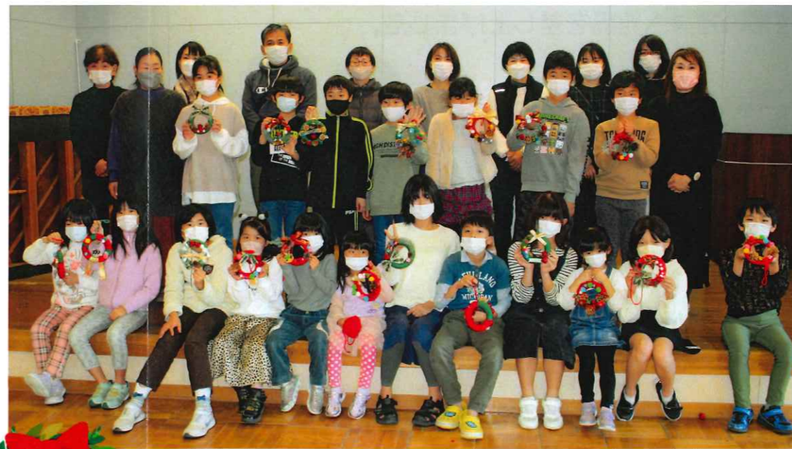
楽しく素敵なクリスマスリースを作りました