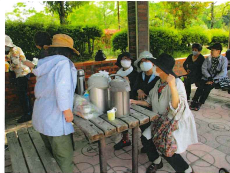
久しぶりに会って情報交換 (おしゃべり 大好き)