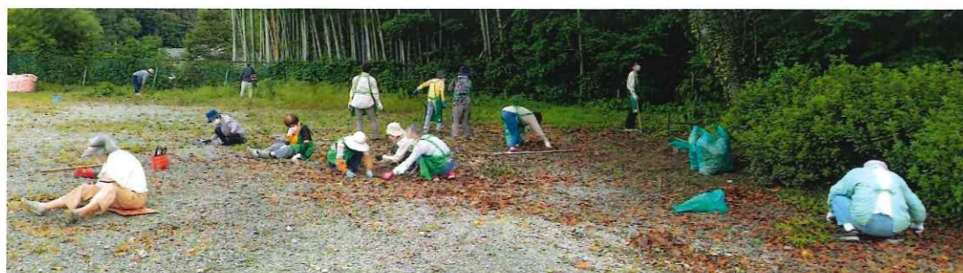
皆さんと月1回 朝40分の奉仕作業