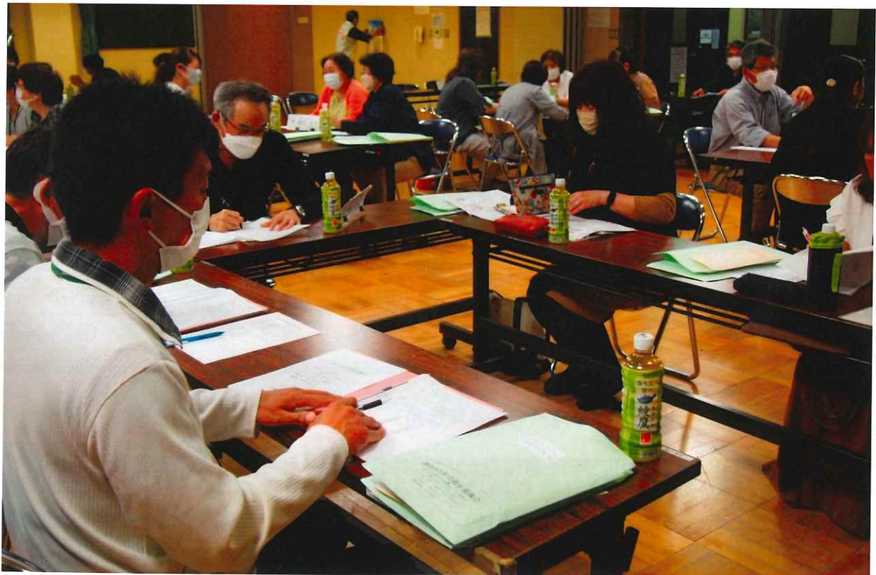
5/28(土)の福祉員集会の様子