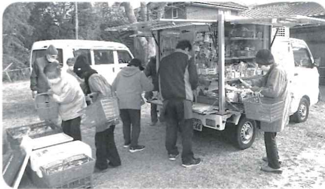
鶴見台地区試験販売の様子

現在、コープやまぐちによる移動販売が希望する地区に出向き試験的に実施されています。