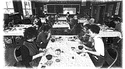
食事交歓会の様子

70歳以上ひとり暮らし高齢者の孤独感の解消、交流、楽しみの場の提供。手作りの料理を皆で頂き、クイズ、歌簡単な体操等で過ごしていただく。（原則毎月第3木曜日に実施）