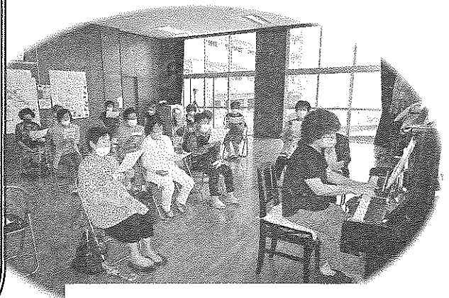
懐かしの歌を全員で歌います