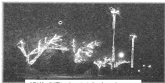
緑道で輝いたイルミネーション

さて、コロナ禍の昨年十二月中旬から今年一月十日にかけて、各方面からご協力をいただき、地区社協主催で下の写真のようなイルミネーションを緑道に設置