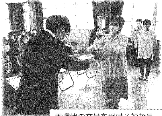
委嘱状の交付を受ける福祉員

福祉員さんは「安心して暮らすことのできるまちづくり」を進めていくうえでも、地域住民にとって一番身近な地域福祉の担い手として頼りにされています。市社会福祉協議会や民生委員さんと連携しつつ、地域の福祉問題の把握やネットワーク活動への参加をしていただきます。