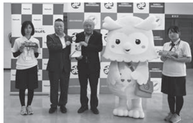
株式会社ヤクルト山陽 様