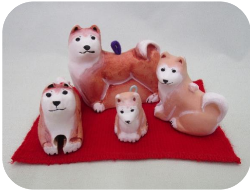
① 親子干支土鈴 (ファミリー) ¥1,000