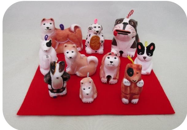
⑨ 戌の仲間たち ¥3,000