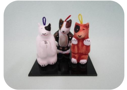
③ プラザースⅢ ¥800 良い子 悪い子 普通の子