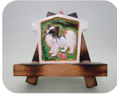
② 干支飾り ¥800