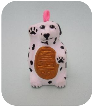
④ 招き戌 ¥500