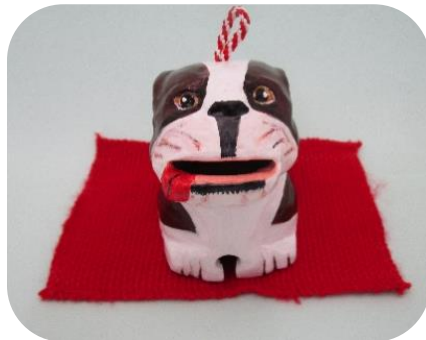
⑤ いぬ貯金箱 ¥500