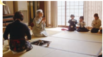
「茶道教室」と「読み聞かせの会」は毎月1回講師をお願いしています。