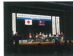
社会福祉団体の活動助成