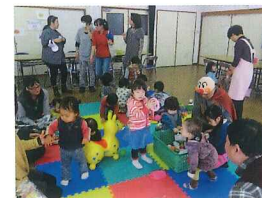
子育て支援の充実