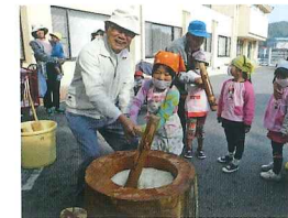
地区社協への活動助成