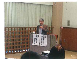
ボランティア団体への活動助成