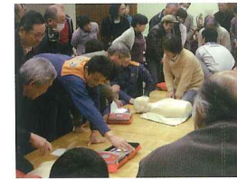
災害に備えてボランティア講座開催