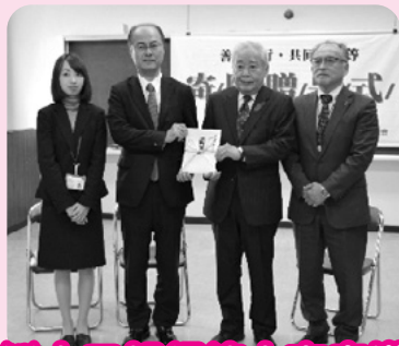
株山口銀行徳山支店様