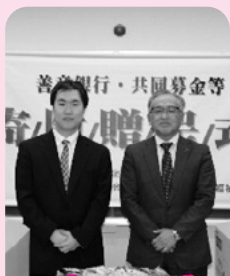
ベガスベガス 周南店様