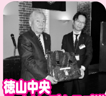
徳山中央 ライオンズクラブ様