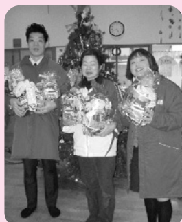
マルハン周南店様