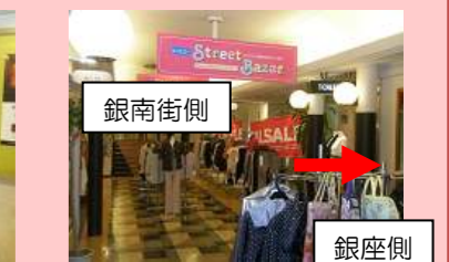
テアトル十八番街